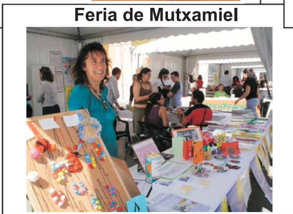
Feria de Mutxamiel