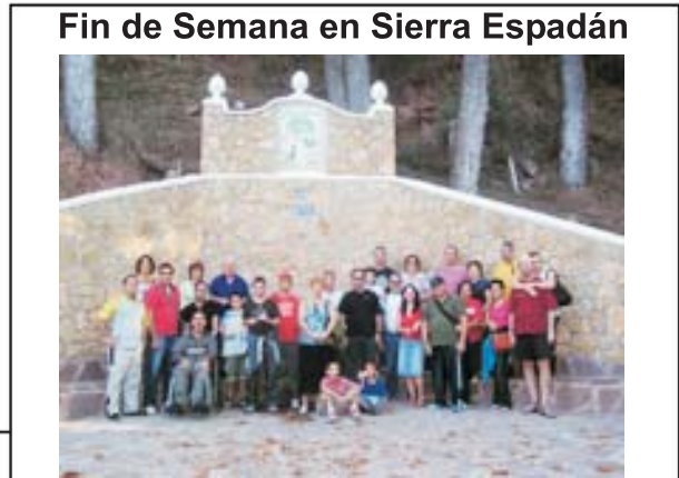
Fin de Semana en Sierra Espadán